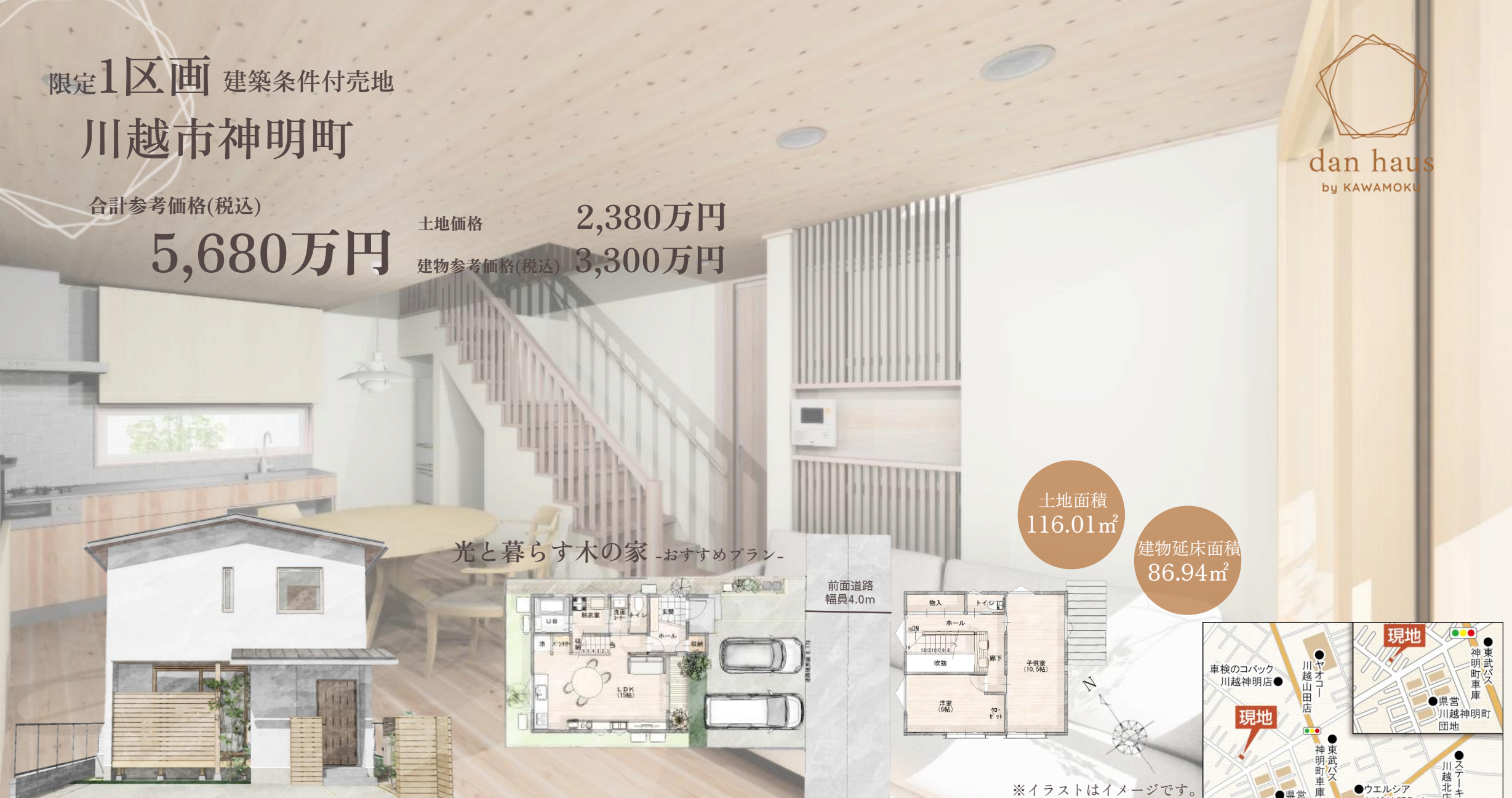
光と暮らす木の家 -おすすめプラン-