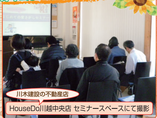
川木建設の不動産店