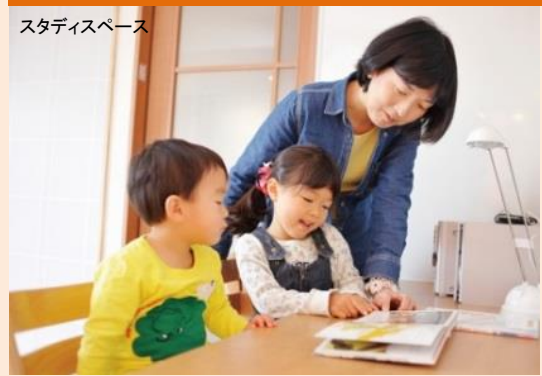
スタディスペース